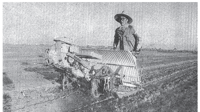
昭和49年 田園を走る