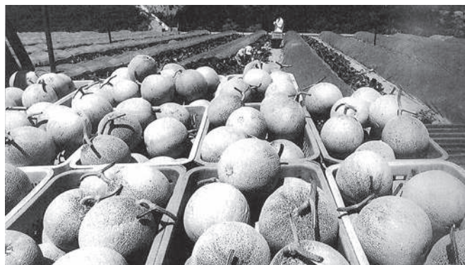
平成8年 メロンの収穫