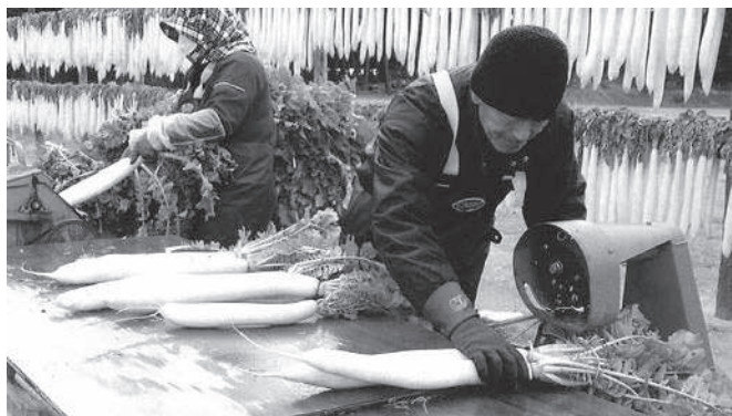
平成27年 大根収穫作業