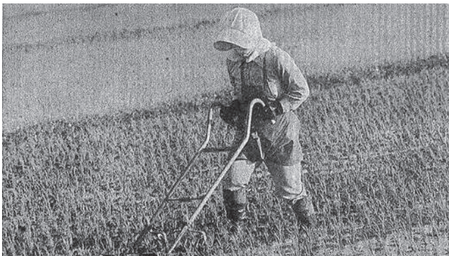
昭和49年 除草する若い人