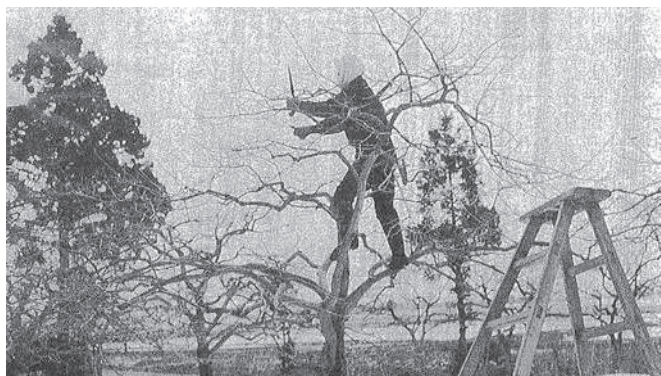
昭和41年 柿の木のせん定