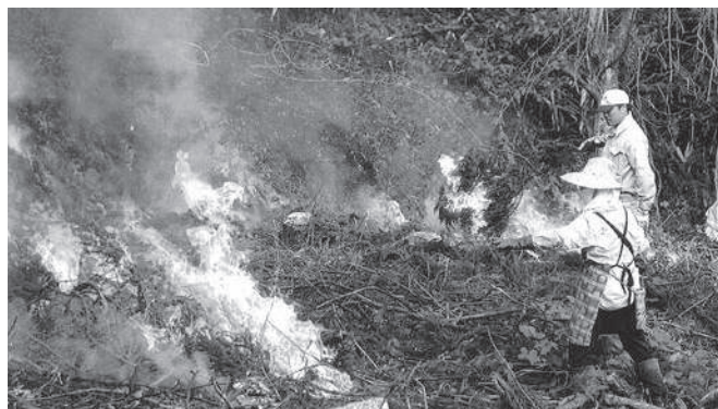
平成28年 藤沢かぶの焼き畑