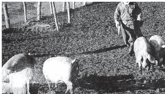
昭和50年 ブタの散歩